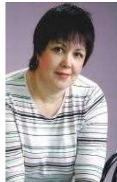
Зав. заочным отделением, преподаватель русского языка и литературы

интересными, активными людьми, любящими свою специальность и профессию, техникум, Родину.